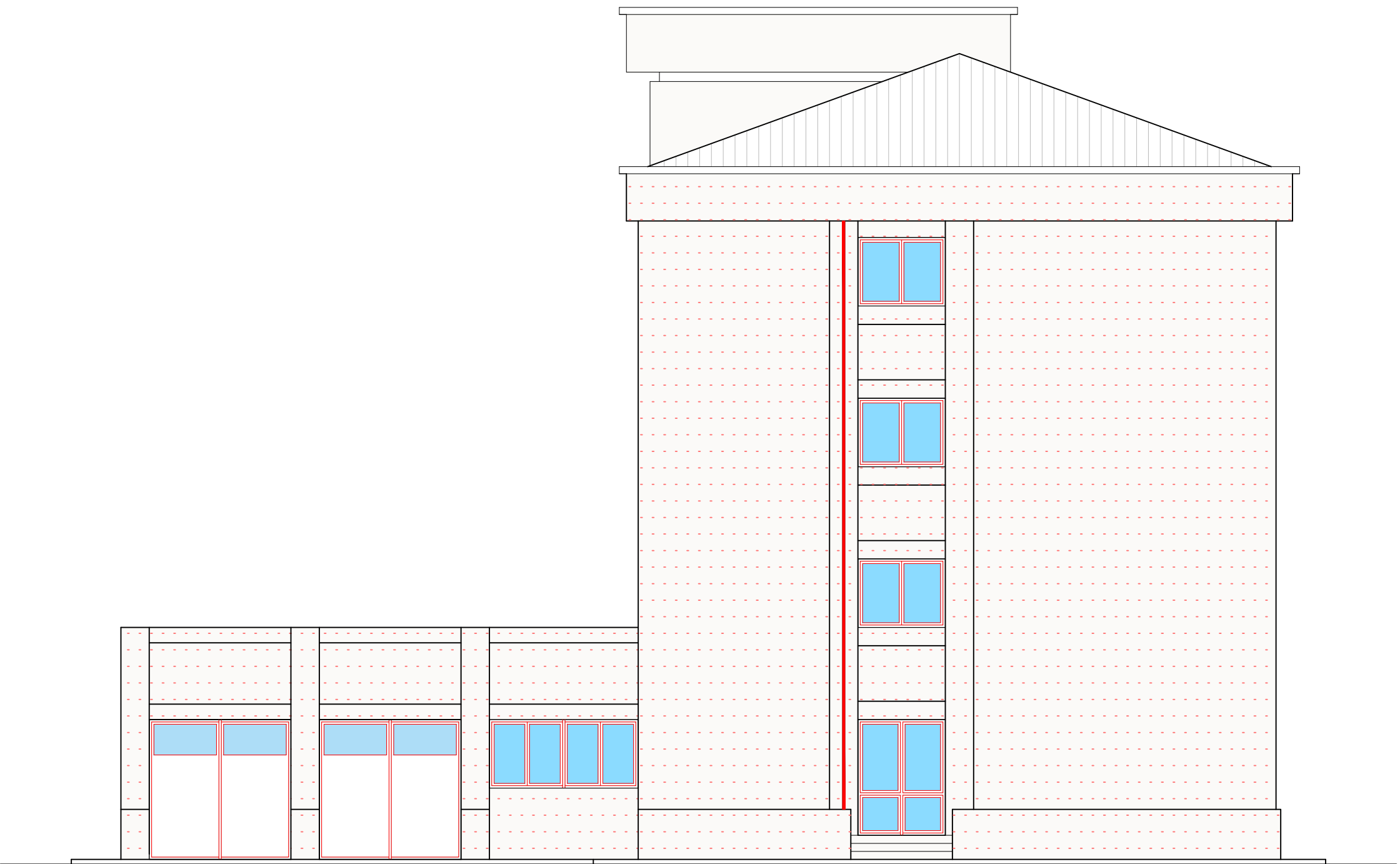
PROSPETTO NORD- OVEST