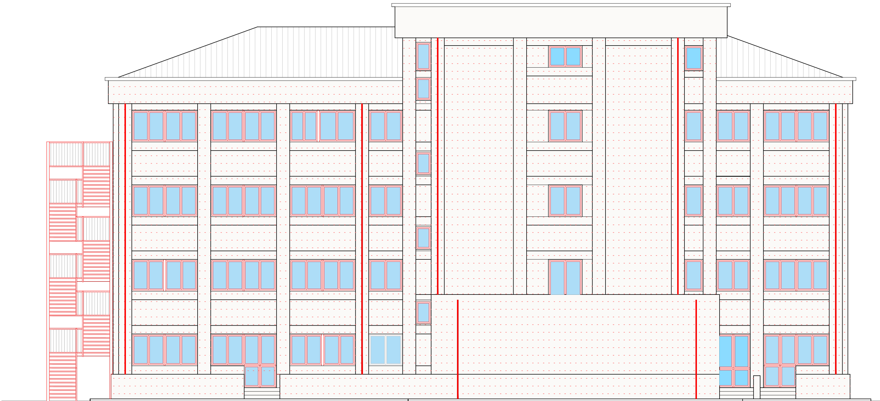
PROSPETTO NORD - EST