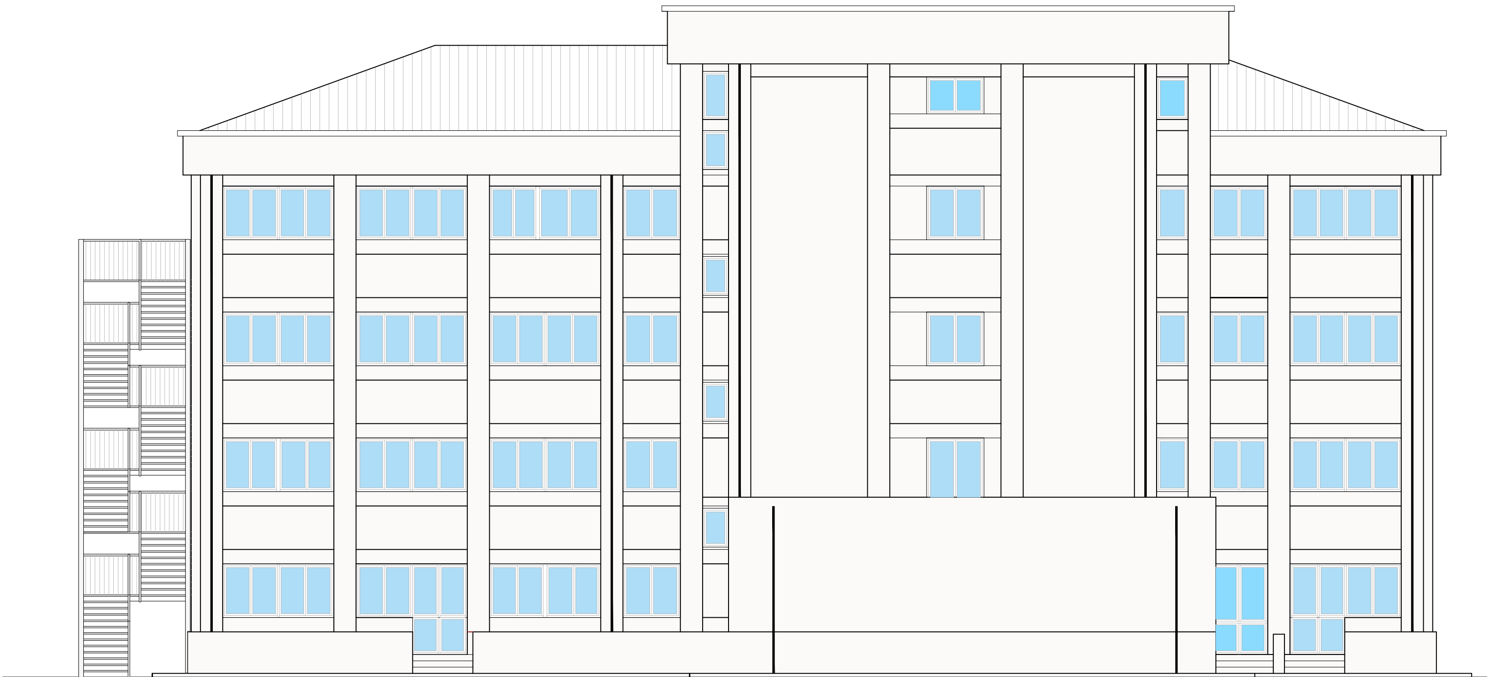
PROSPETTO NORD - EST