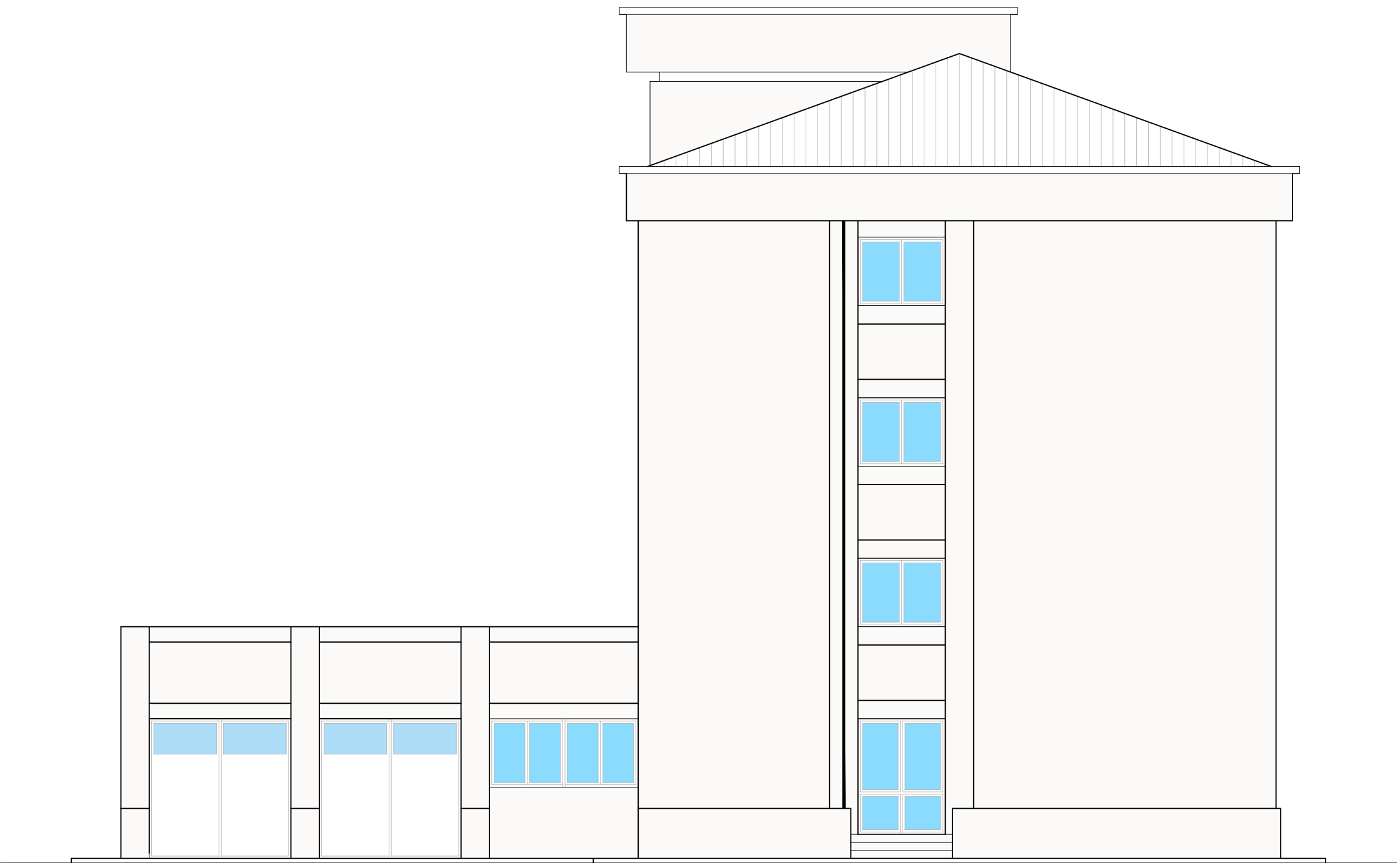
PROSPETTO NORD- OVEST