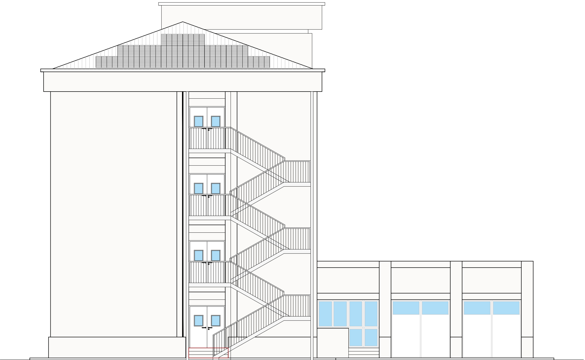
PROSPETTO SUD - EST