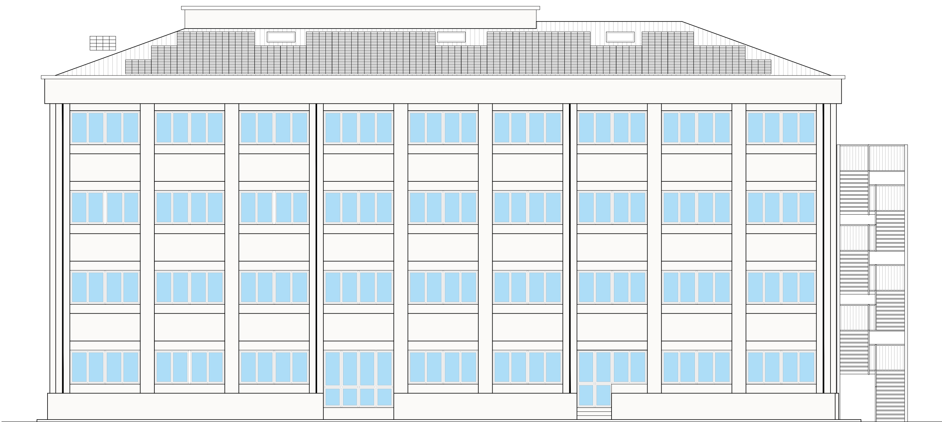
PROSPETTO SUD - OVEST