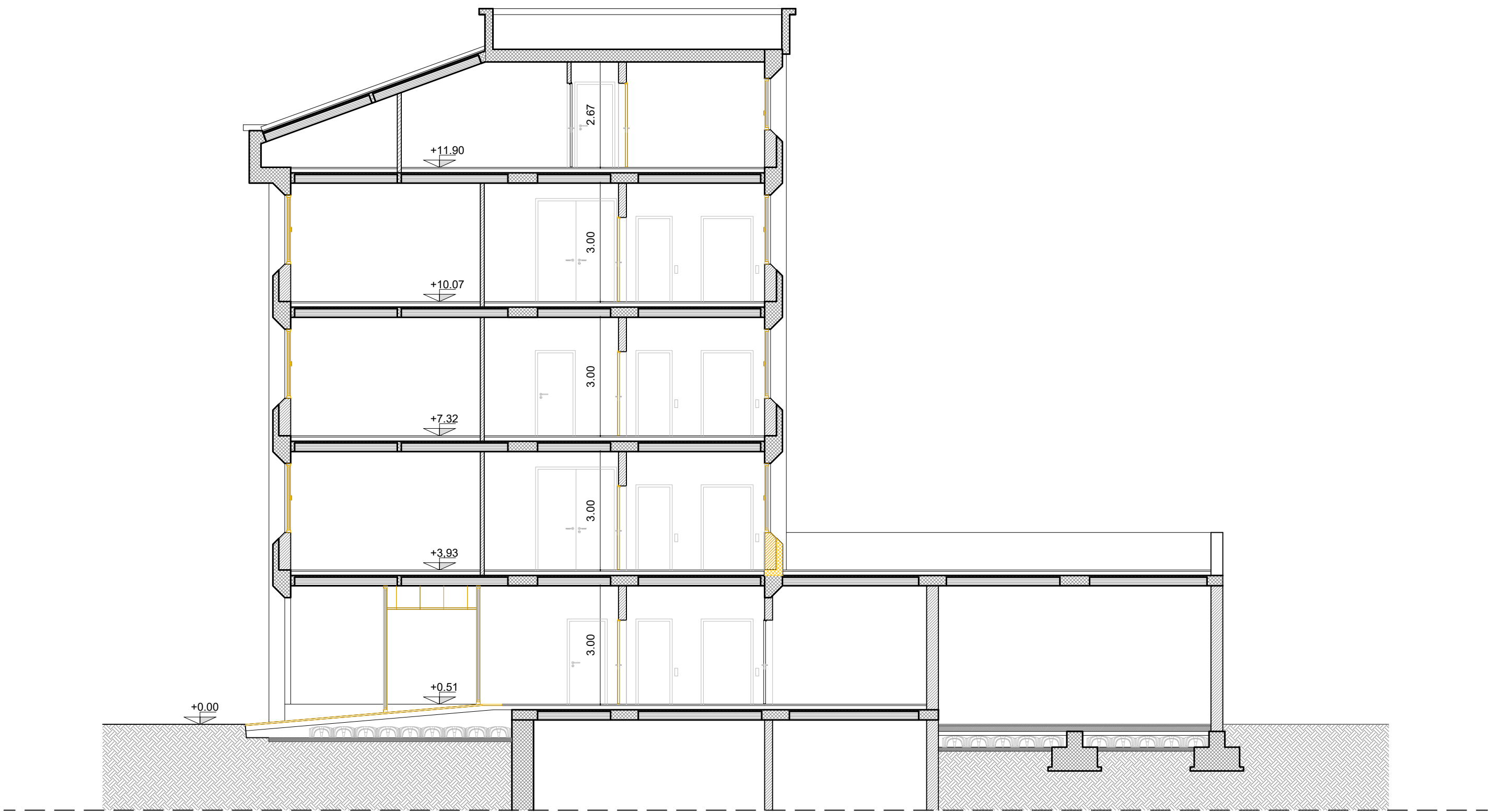
SEZIONE A - A'