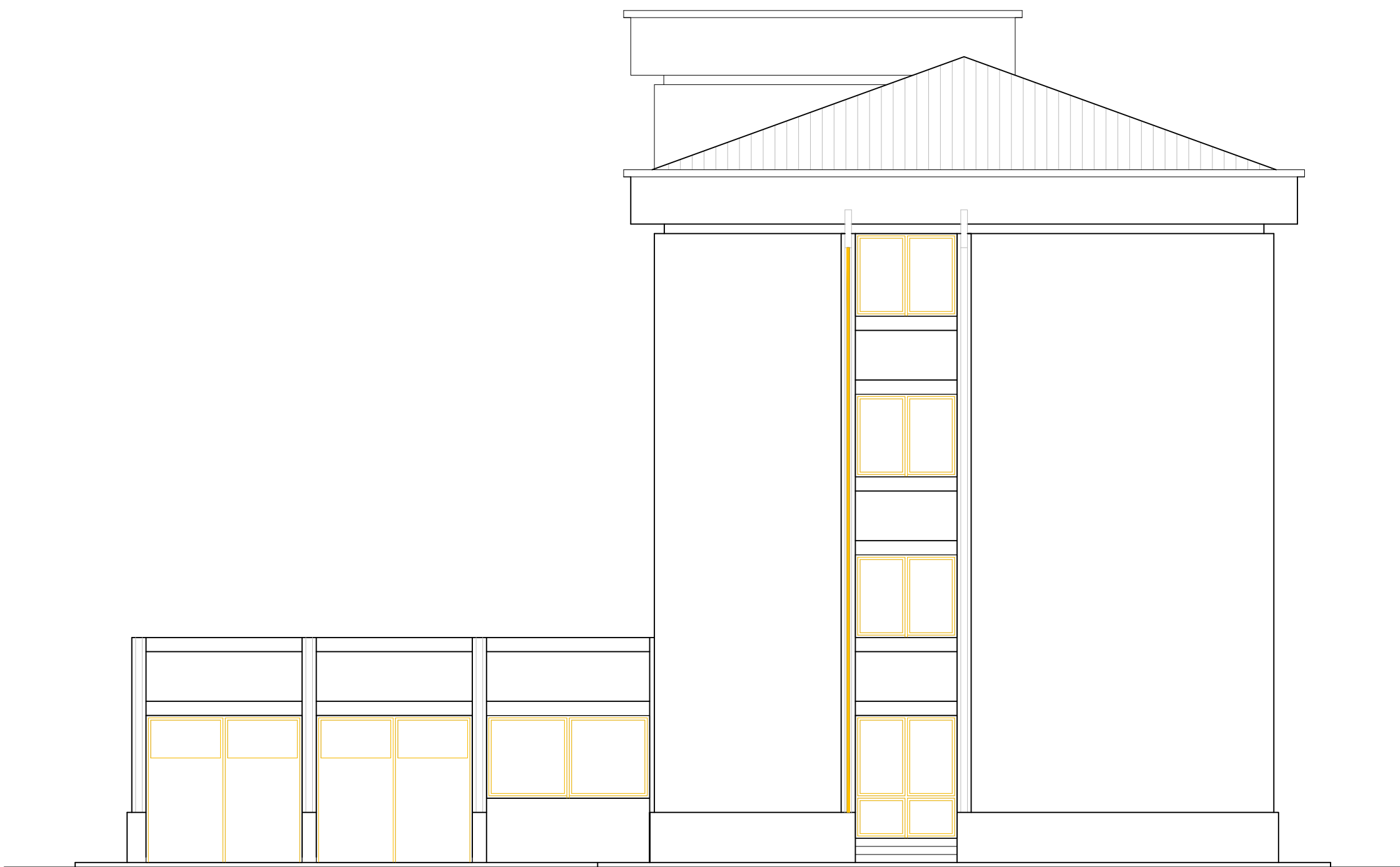
PROSPETTO NORD- OVEST