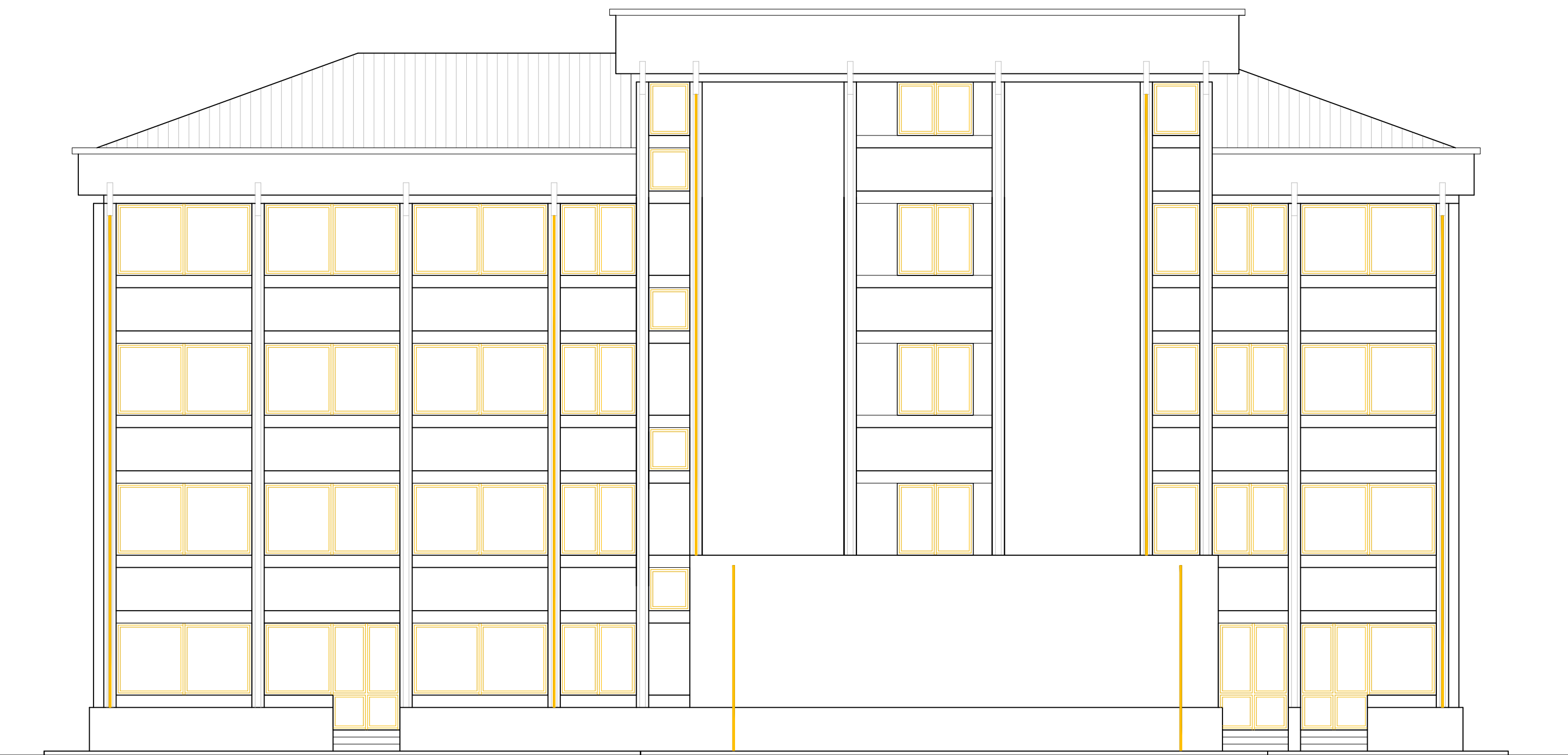
PROSPETTO NORD - EST