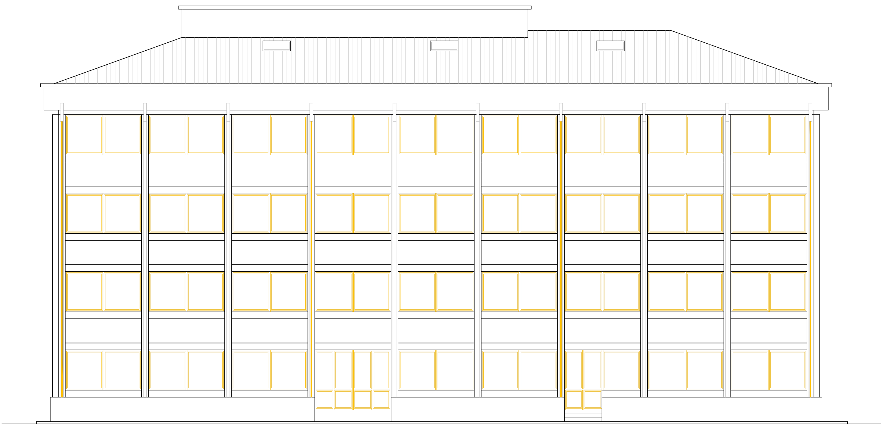
PROSPETTO SUD - OVEST