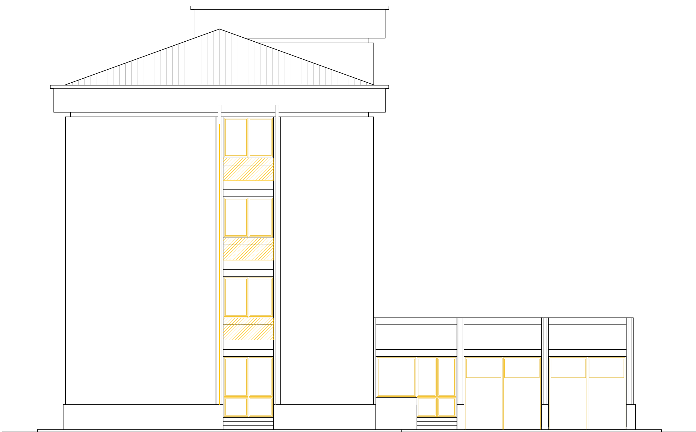
PROSPETTO SUD - EST