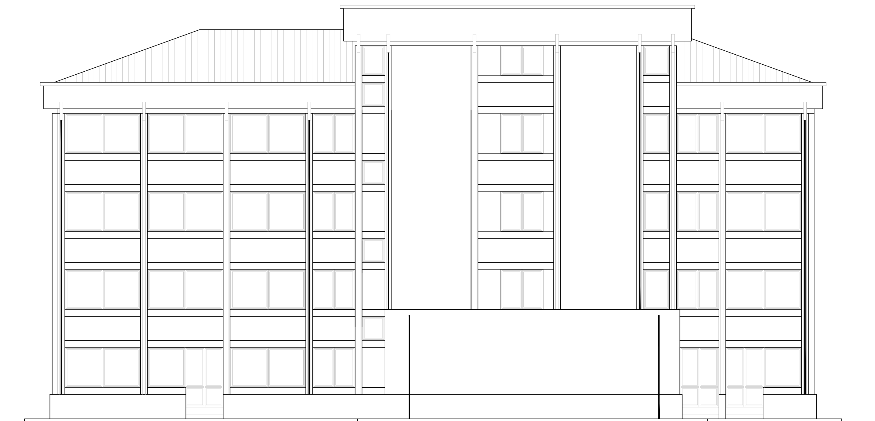
PROSPETTO NORD - EST