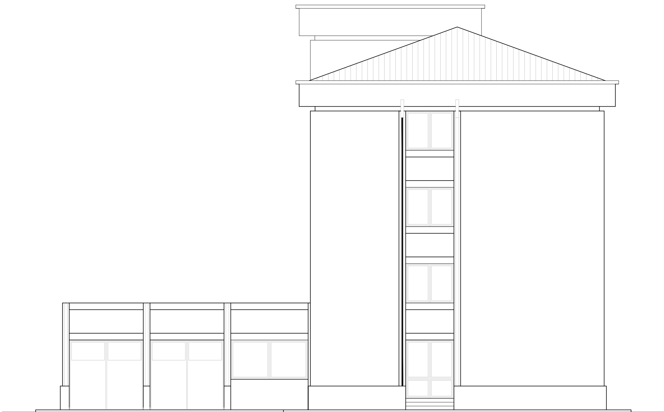
PROSPETTO NORD- OVEST