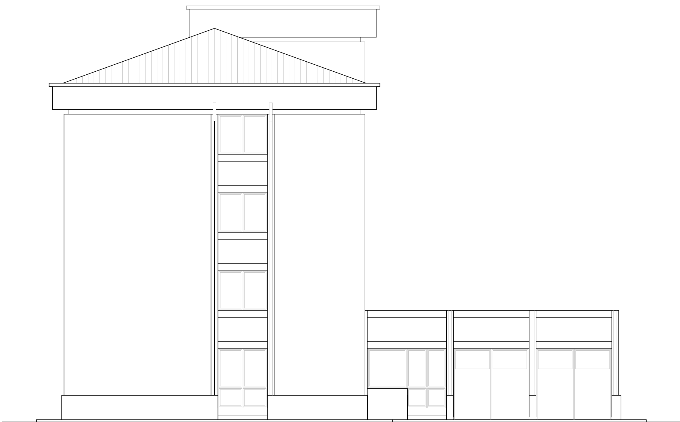
PROSPETTO SUD - EST