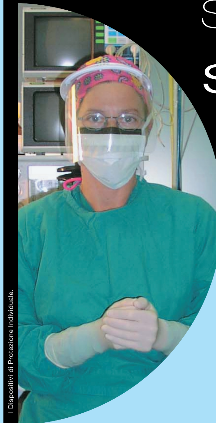
I Dispositivi di Protezione Individuale.